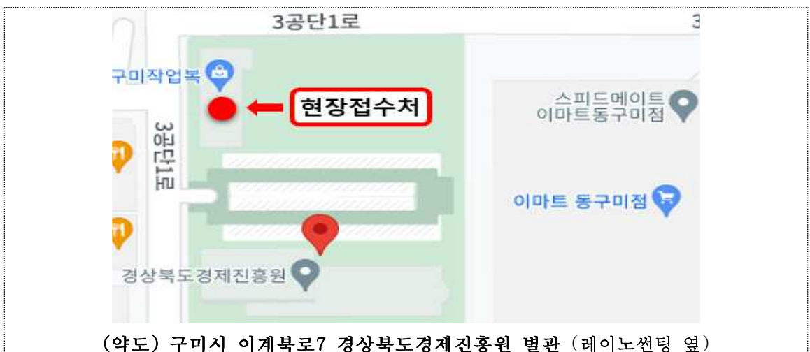
(약도) 구미시 이계북로7 경상북도경제진흥원 별관 (레이노션팅 옆)

- 경상북도경제진흥원 별관 1층(구미시 이계북로 7 근린생활시설 105호)